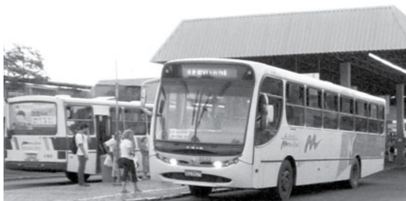
Sem concorrência: De acordo com edital, empresas atuarão em rotas diferentes

M ais uma vez a administração de Marília vai contra o interesse popular. De acordo com a Prefeitura, o Edital do Transporte Coletivo, criado para que uma nova empresa possa prestar serviços à população, será