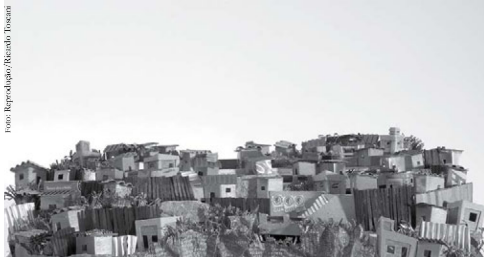
Se os políticos parassem de brincar com o dinheiro público, o que mudaria na sua vida hoje?

O problema da falta de moradia diminuiria 74,3% se os políticos parassem de brincar com dinheiro público, o dinheiro do povo, e investissem em moradia. Hoje, a expectativa do PAC é atender 3,9 milhões de famílias. Se o dinheiro dos nossos tributos fosse para onde realmente deveria ir, outras 2,9 milhões de famílias poderiam ter sua casa própria.