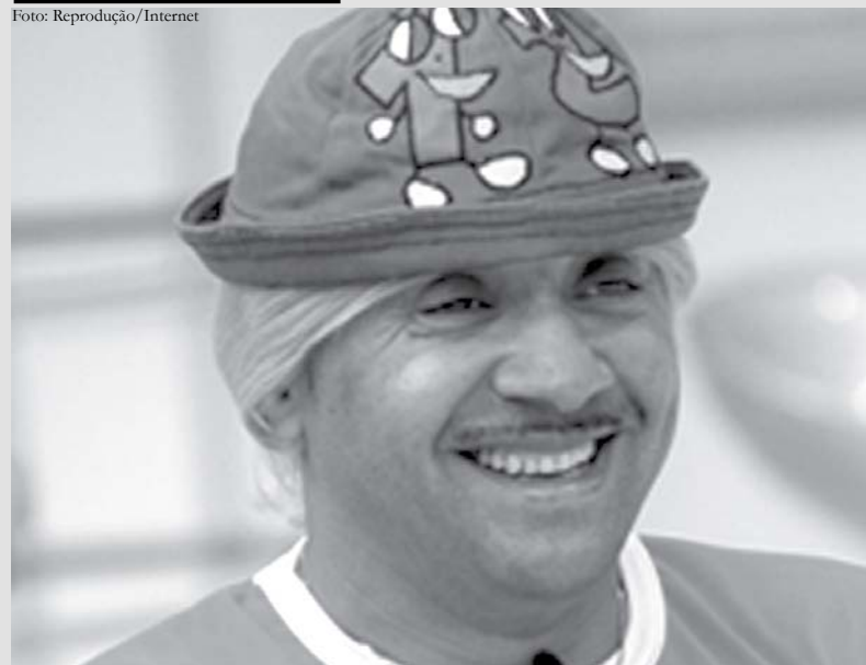
Com piadas e número fácil de decorar, Tiririca é o "puxador de votos" do PR