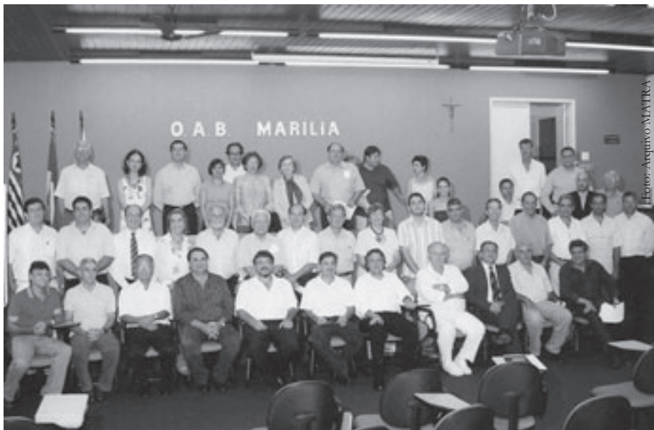
Outubro de 2006: Toma posse a primeira diretoria da MATRA - Marília Transparente