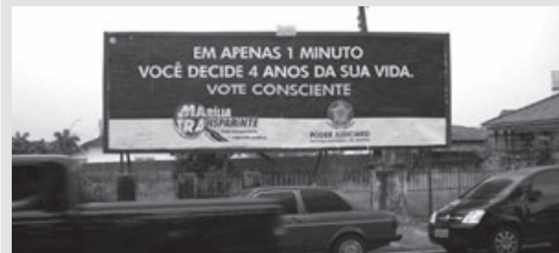
Outdoor divulgado pela MATRA com apoio da Justiça Eleitoral em Marília

Para a MATRA, essas alertas continuam valendo para o segundo turno das eleições. Fique esperto.