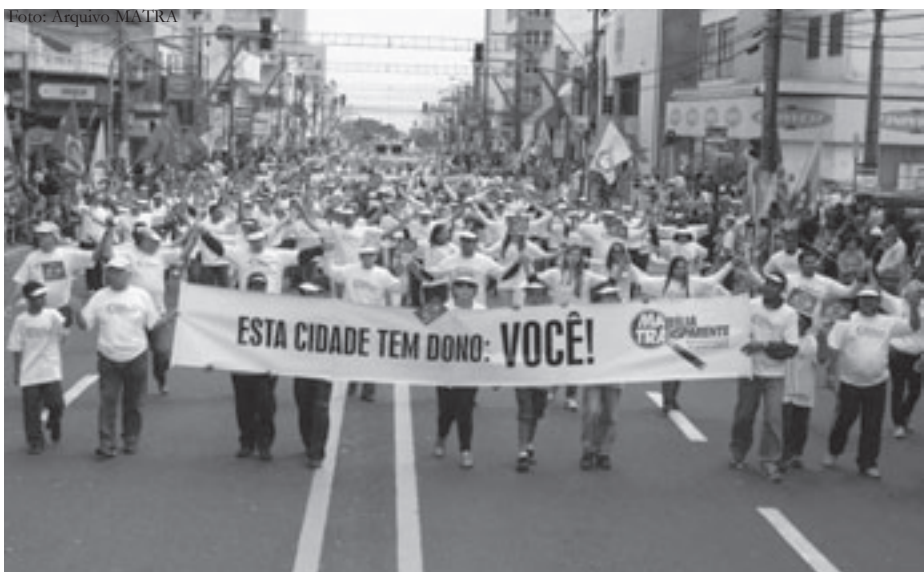
Setembro de 2009: MATRA participa do desfile cívico de Sete de Setembro