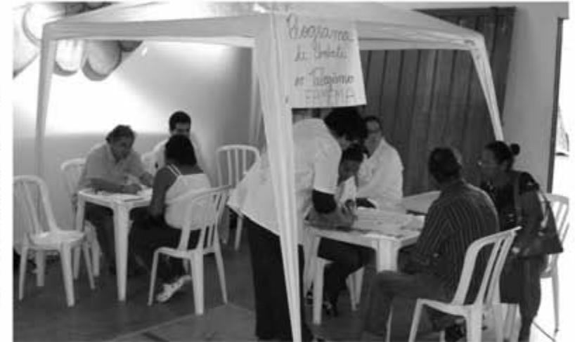
Tenda destinada ao programa de Controle de Tabagismo

local, funcionários de órgãos públicos municipais, estaduais e federais, além de outras instituições, para atender a população, tirando dúvidas e resolvendo problemas, como falta de remédios ou revisão de aposentadoria, com rapidez e sem burocracia.