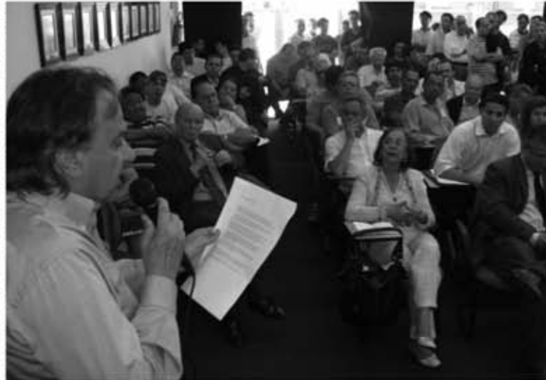
Audiência pública realizada na OAB