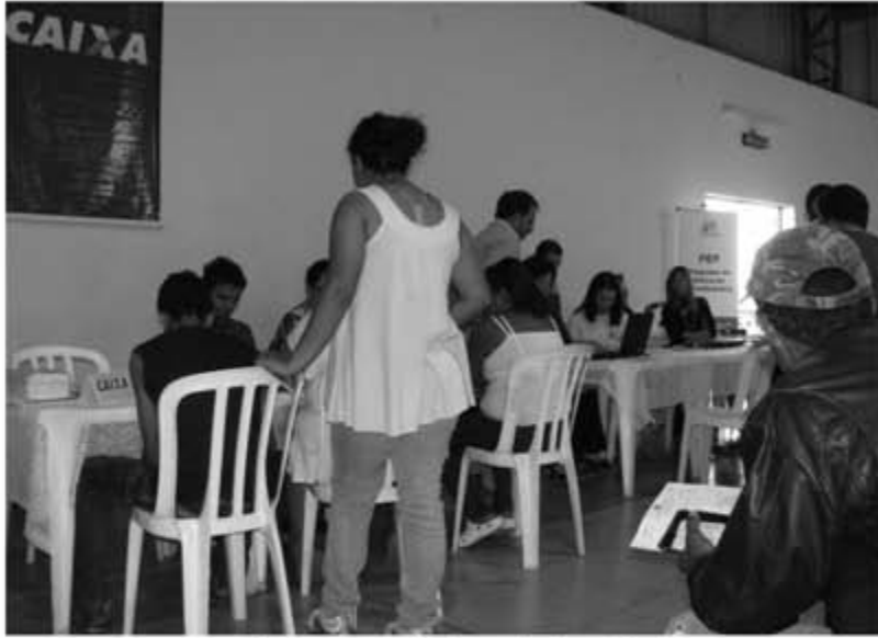
Atendimento realizado à população no Mutirão

Na sua sexta edição em Marília, o Mutirão da Cidadania realizou 929 atendimentos nos dois dias de atividades realizadas na quadra de esportes da igreja Santo Antonio. Mesmo com o movimento intenso, mais uma vez não foram registradas filas, em virtude da estrutura montada e pelo grande número de parceiros (mais de vinte órgãos). O atendimento médico foi um dos principais destaques, graças a participação de estagiários da Faculdade de